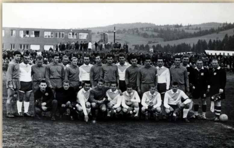
Spoločná foto pred trojtisícovou návštevou.