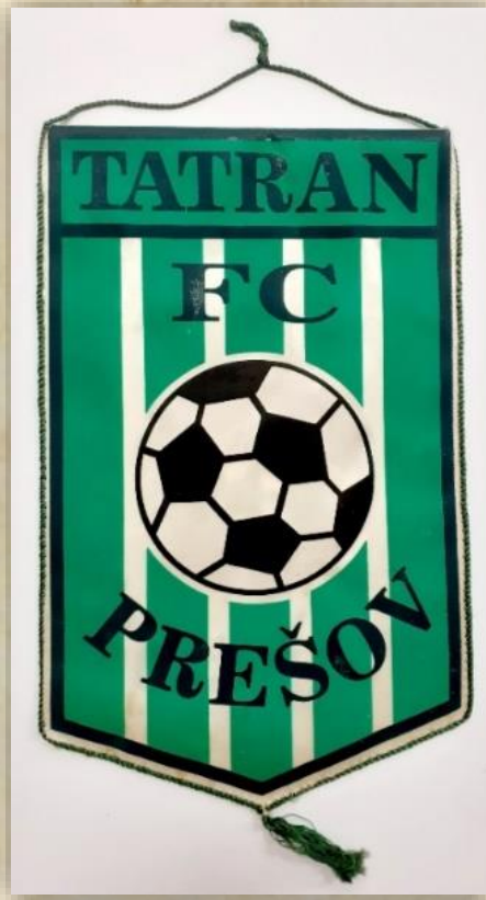
Vlajka Tatran Prešov priamo zo zápasu.

Od obdobia odovzdania futbalového stánku v roku 1972 ho na svoju prípravu využili viaceré ligové mužstvá, ako aj slovenská reprezentácia do 18 rokov.