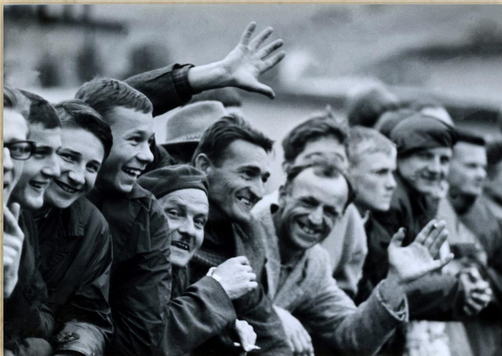
Nehľadiac na výsledok, obecenstvo bolo spokojné.