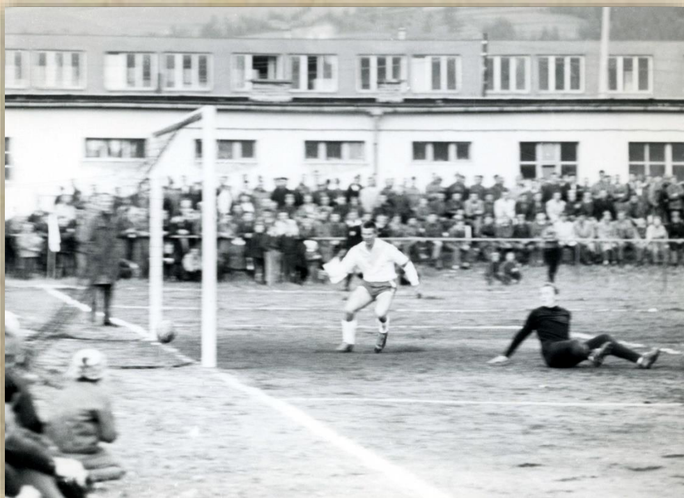
Prvému gólu však Šula zabrániť nevedel.