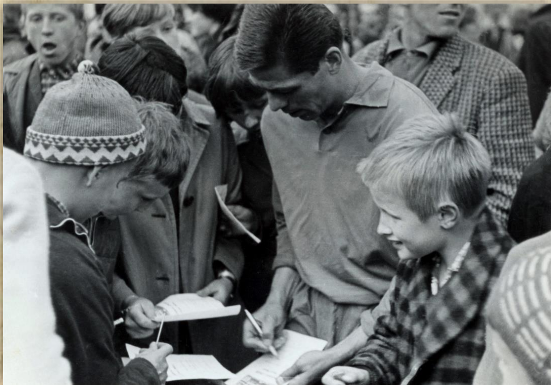
Autogramiáda nemala konca.