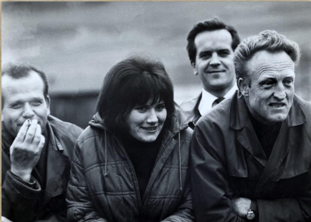
Nehľadiac na výsledok, obecenstvo bolo spokojné.