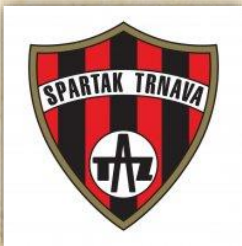
Logo TAZ Spartak Trnava.