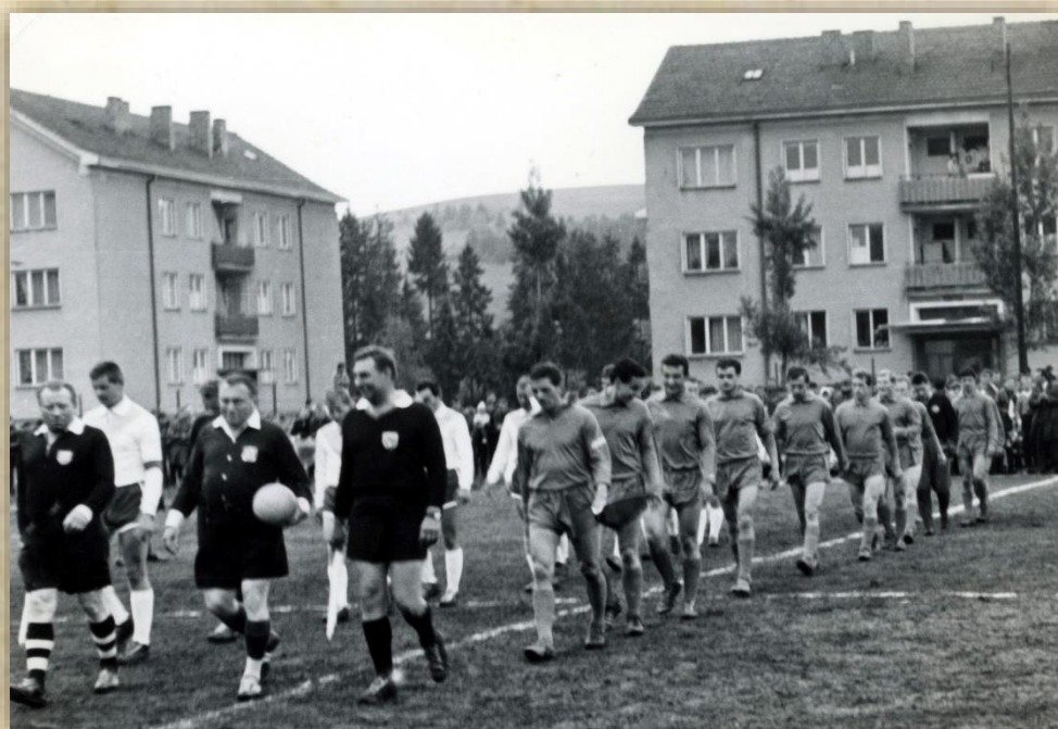
Nástup hráčov (Slovan Bratislava v tmavom).