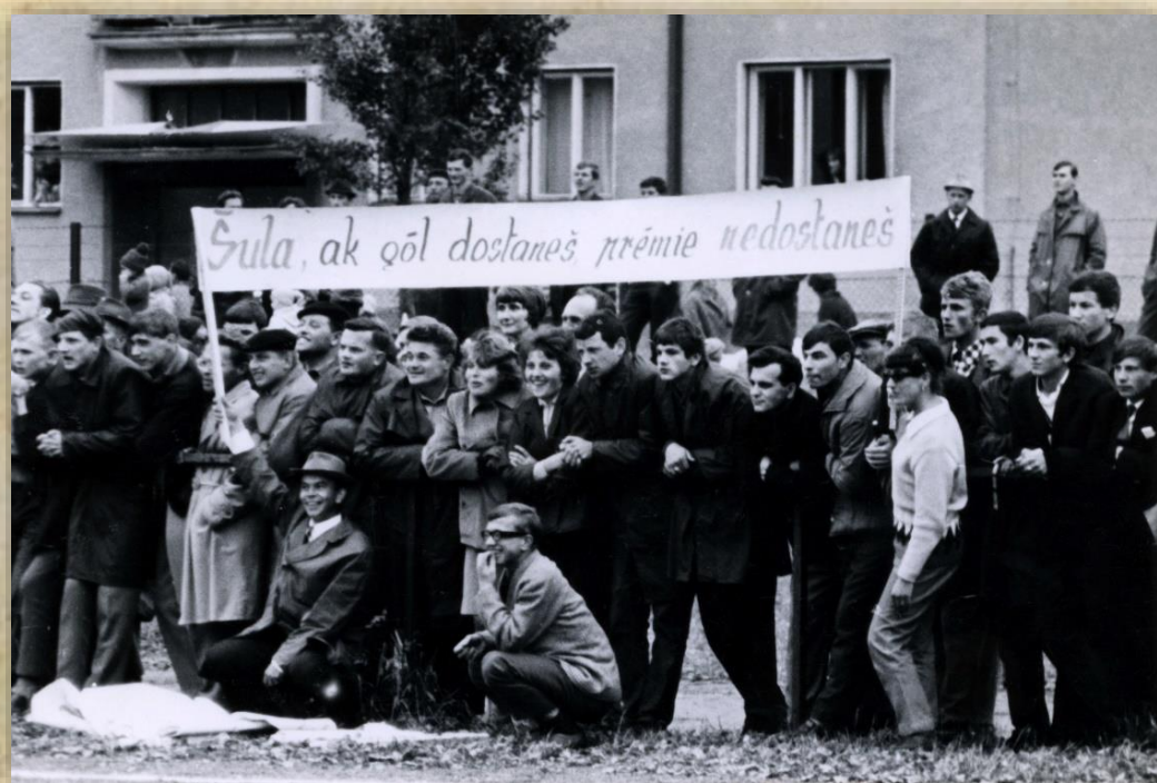
„Šula, ak gól dostaneš, prémie nedostaneš.“