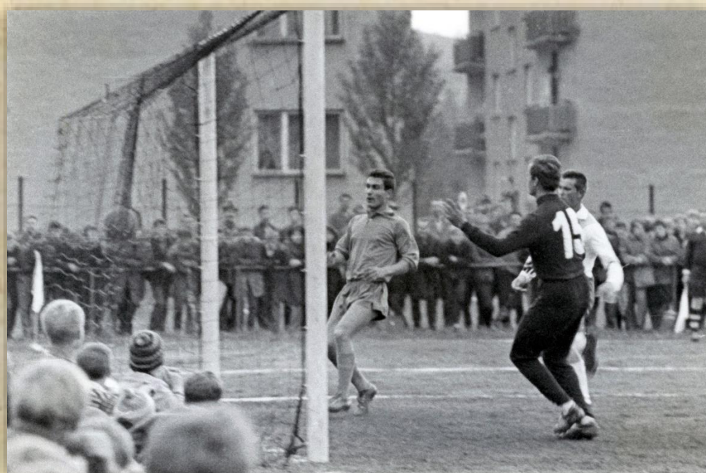
Začiatok gólovej nádielky.