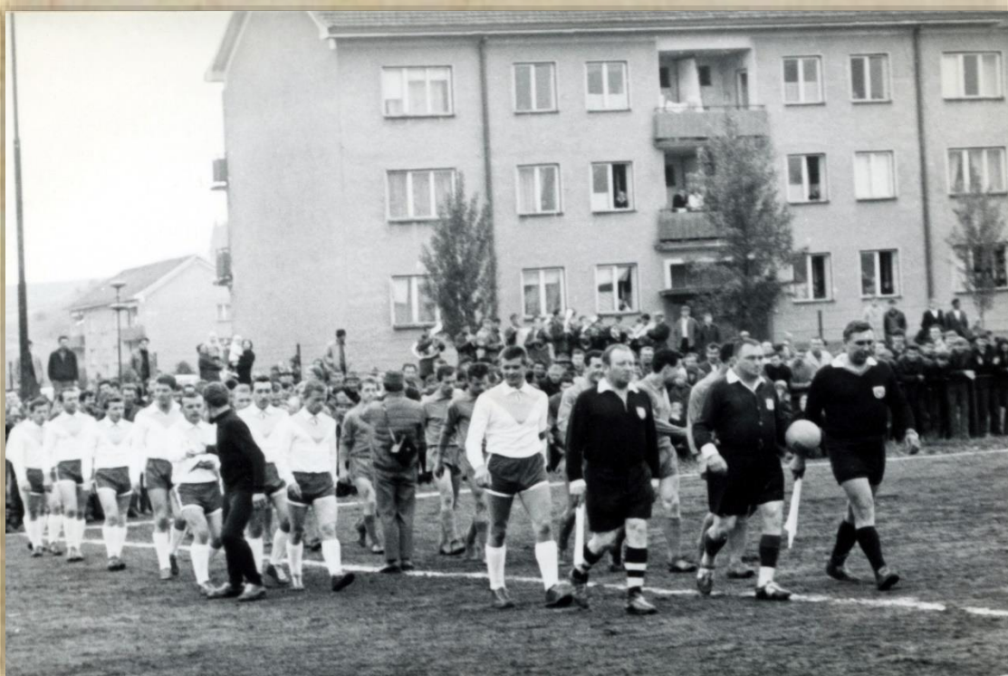
Nástup hráčov (Nižňanci v bielom).