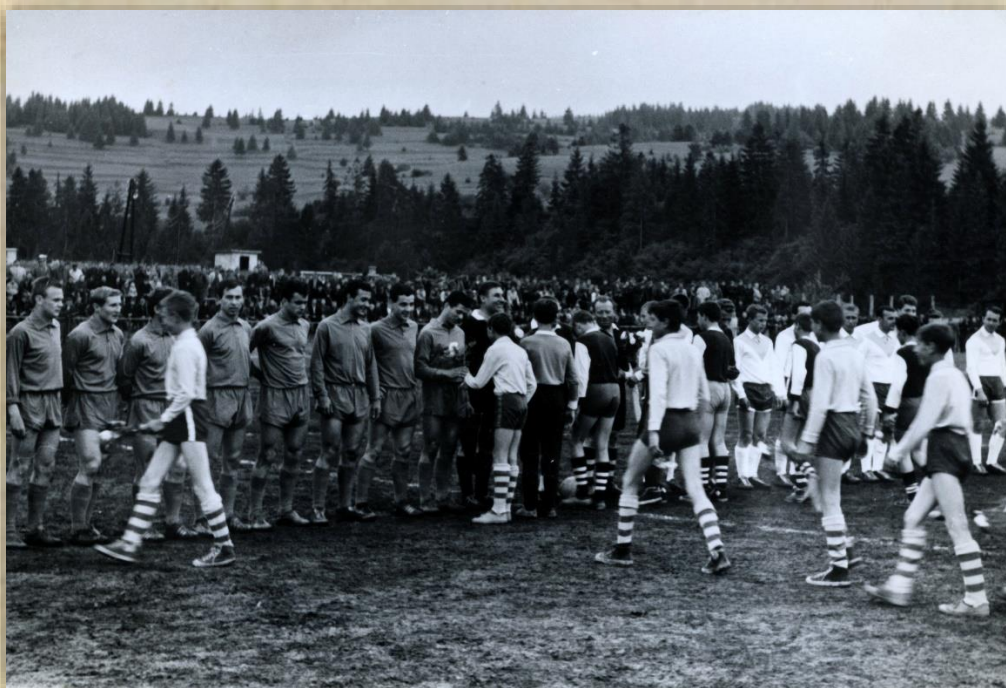
Po nástupe hráčov nasledujú kytice od žiakov.