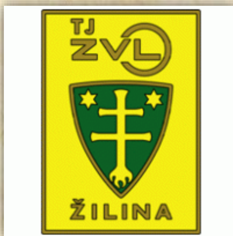
Logo TJ ZVL Žilina

Pri príležitosti otvorenia štadióna SNP v Nižnej, ktoré sa konalo 27.8.1972, sa odohral priateľský futbalový zápas proti ZVL Žilina s výsledkom TJ Tesla Nižná A – ZVL Žilina 1:1.