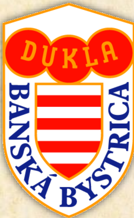
Logo Dukla Banská Bystrica.