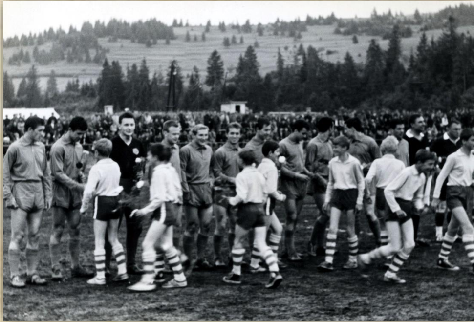
Po nástupe hráčov nasledujú kytice od žiakov.