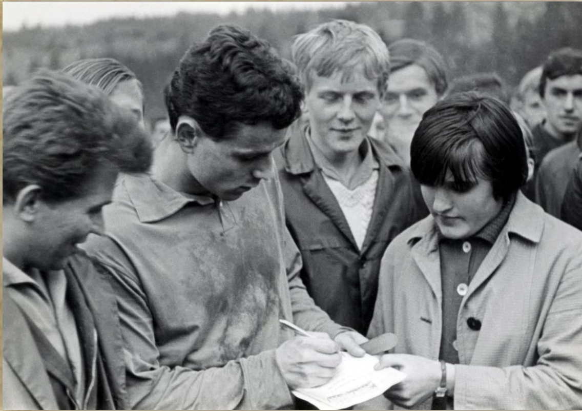
Po zápase nechýbali autogramy.