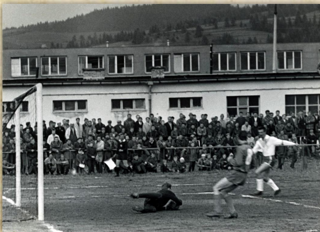
Šula na zemi úspešne chytil loptu.