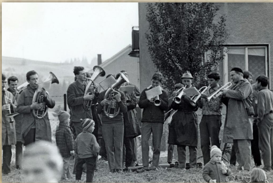
Mužstvo Slovan sme v Nižnej privítali veľkou slávnosťou.