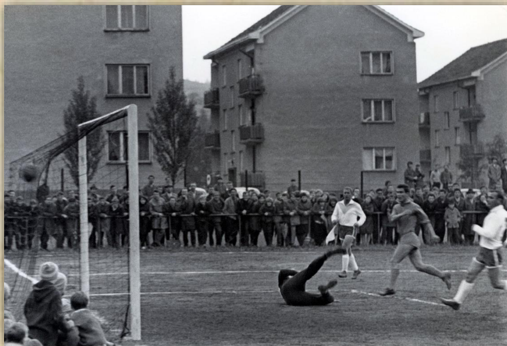
Útok na našu bránu.