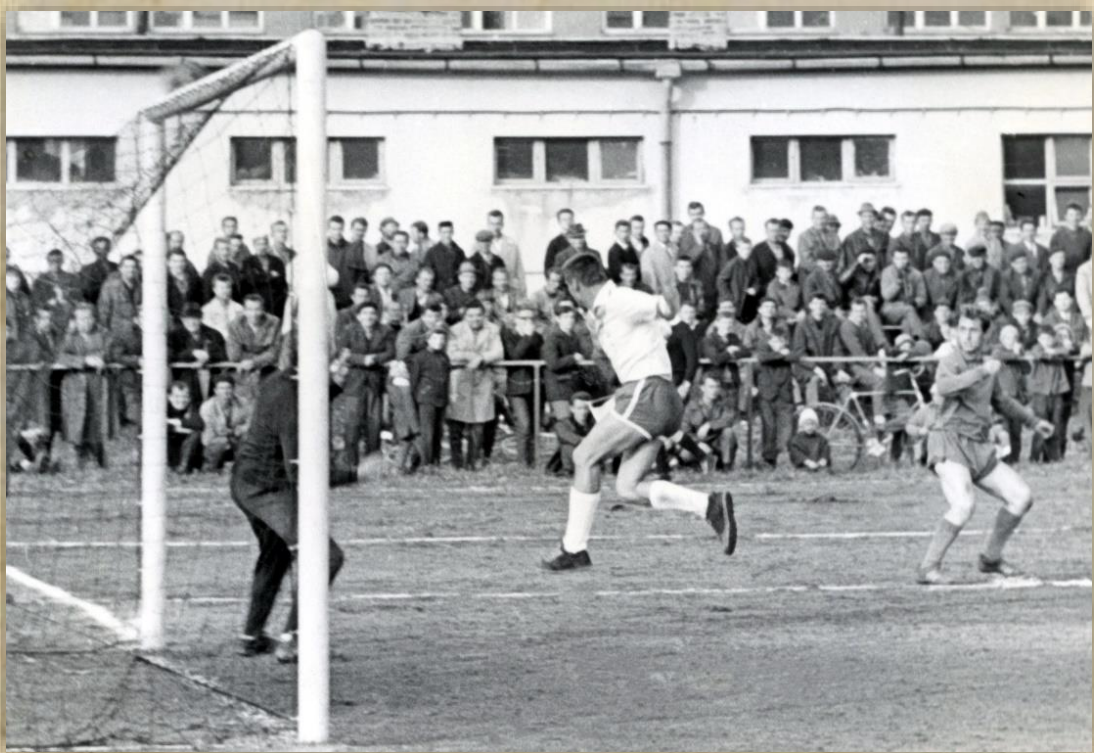
Obrana mala plné nohy práce.