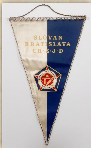
Vlajka TJ Slovan Bratislava CHZJD priamo zo zápasu.