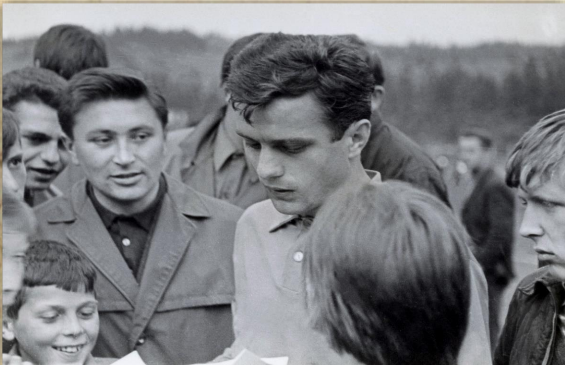
O hráčov Slovan Bratislava bol záujem.