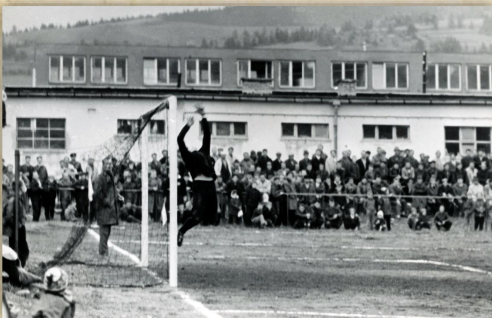
Šula nezabránil ani druhému gólu, pri ktorom sa zranil.