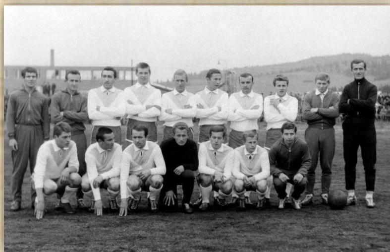
Domáca TJ Tesla Orava Nižná pred zápasom.