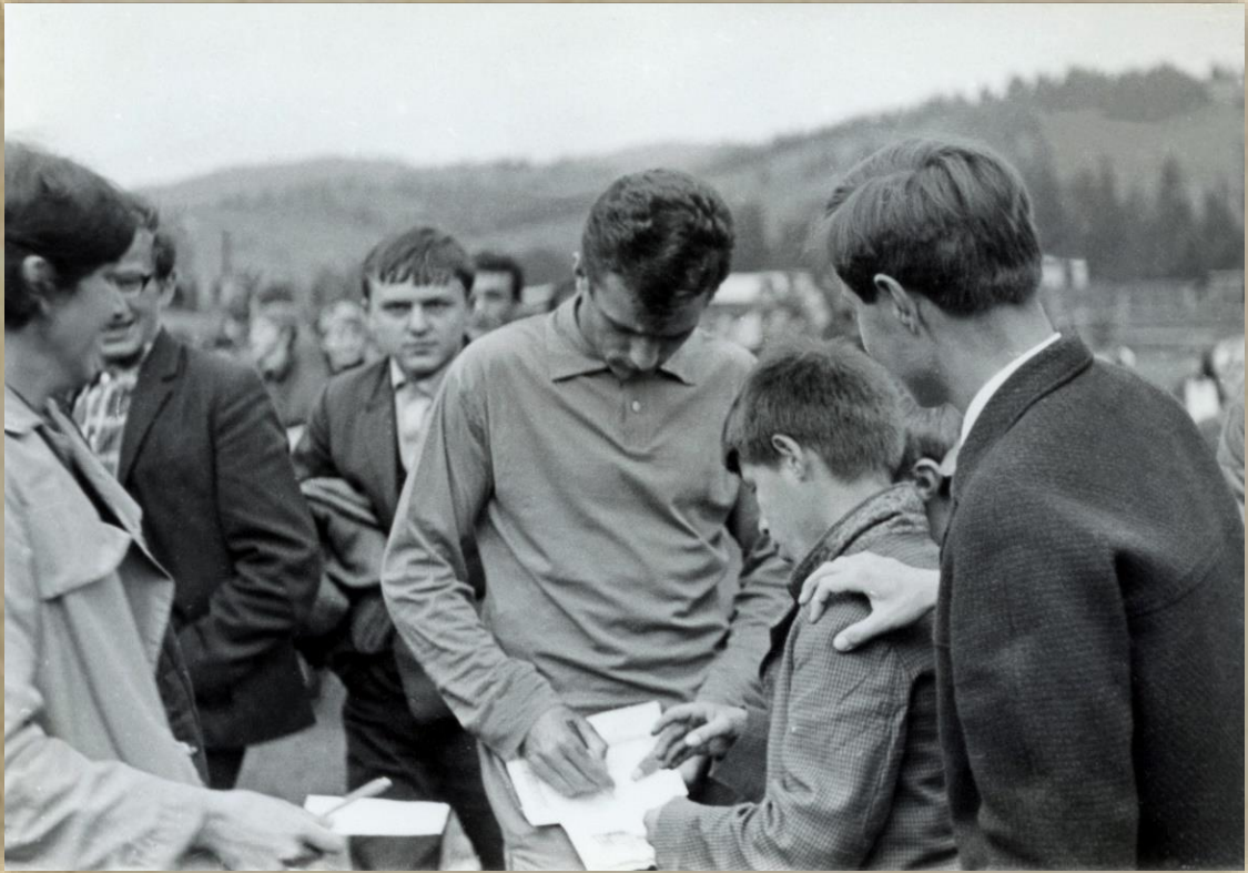
O hráčov Slovan Bratislava bol záujem.